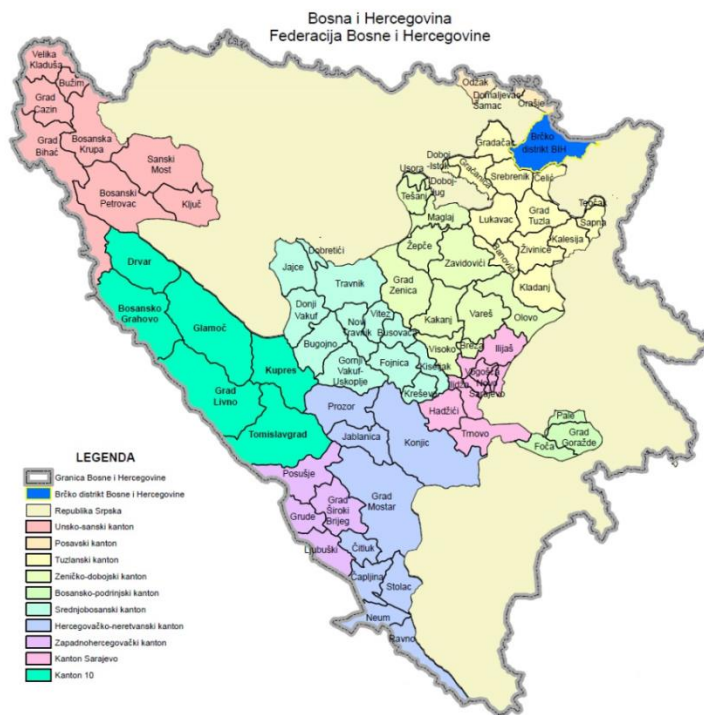
Slika 1. FBiH

Zakonski okvir koji uređuje oblast upravljanja otpadom čini Zakon o upravljanju otpadom Federacije BiH („Sl. novine FBiH“ br. 33/03, 71/09 i 92/17) te na području Općine Ilidža važeći Zakon o komunalnoj čistoći („Sl. novine KS“ br. 14/16, 43/16, 19/17, 20/18 i 22/19) i Zakon o komunalnim djelatnostima („Sl. novine KS“ br. 14/16, 10/17, 20/18 i 22/19).