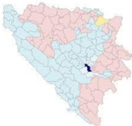
Slika 2. Položaj općine Ilidža

Na teritoriji općine Ilidža u značajnoj mjeri je razvijena putna mreža i lokalni saobraćaj unutar svake mjesne zajednice i mjesnih zajednica međusobno. Ta povezanost se ostvaruje kroz lokalne saobraćajnice kao i saobraćajnice od značaja za Kanton Sarajevo.